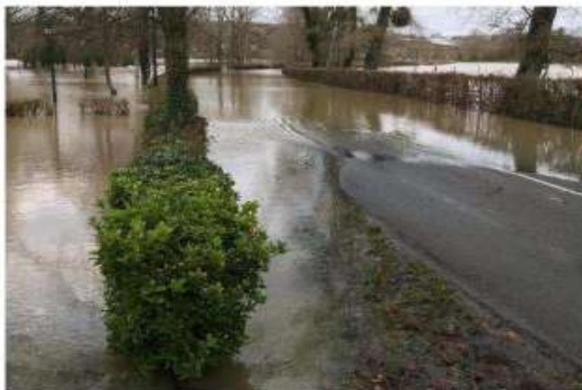
La commune d'Hesdigneul se retrouve régulièrement submergée par les eaux, comme ici en décembre 2019.