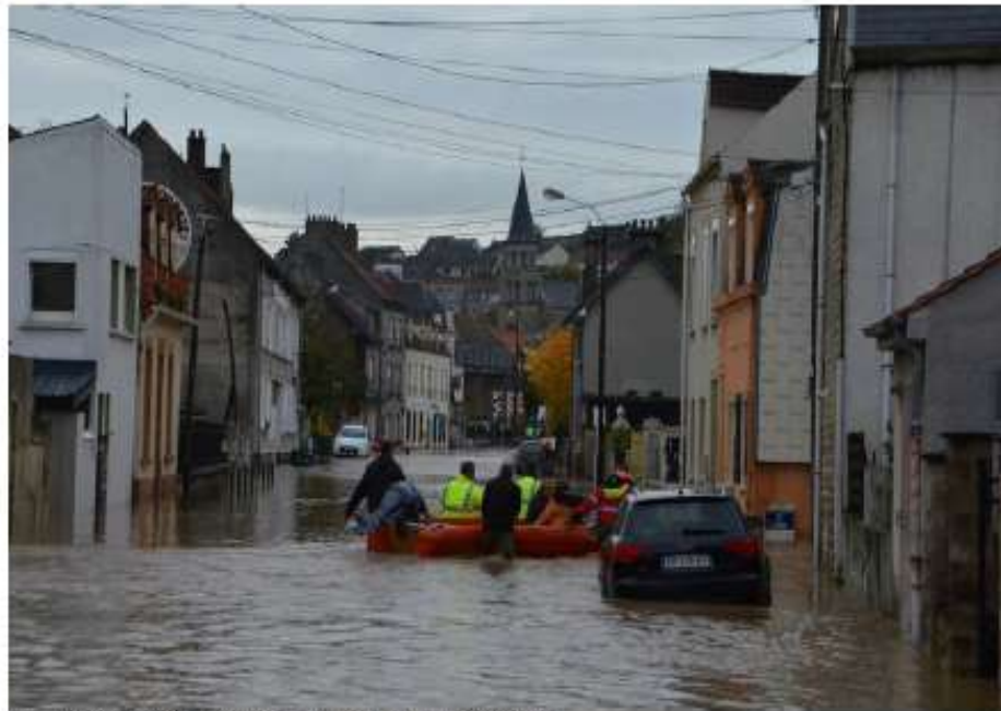
En novembre 2019, le Boulonnais s'était retrouvé sous les eaux, comme ici, rue de la Gare, à Saint-Etienne-au-Mont.

Comme à Saint-Etienne-au-Mont, fortement touchée il y a un an. Un habitant de la Cité de l'Avenir mer-