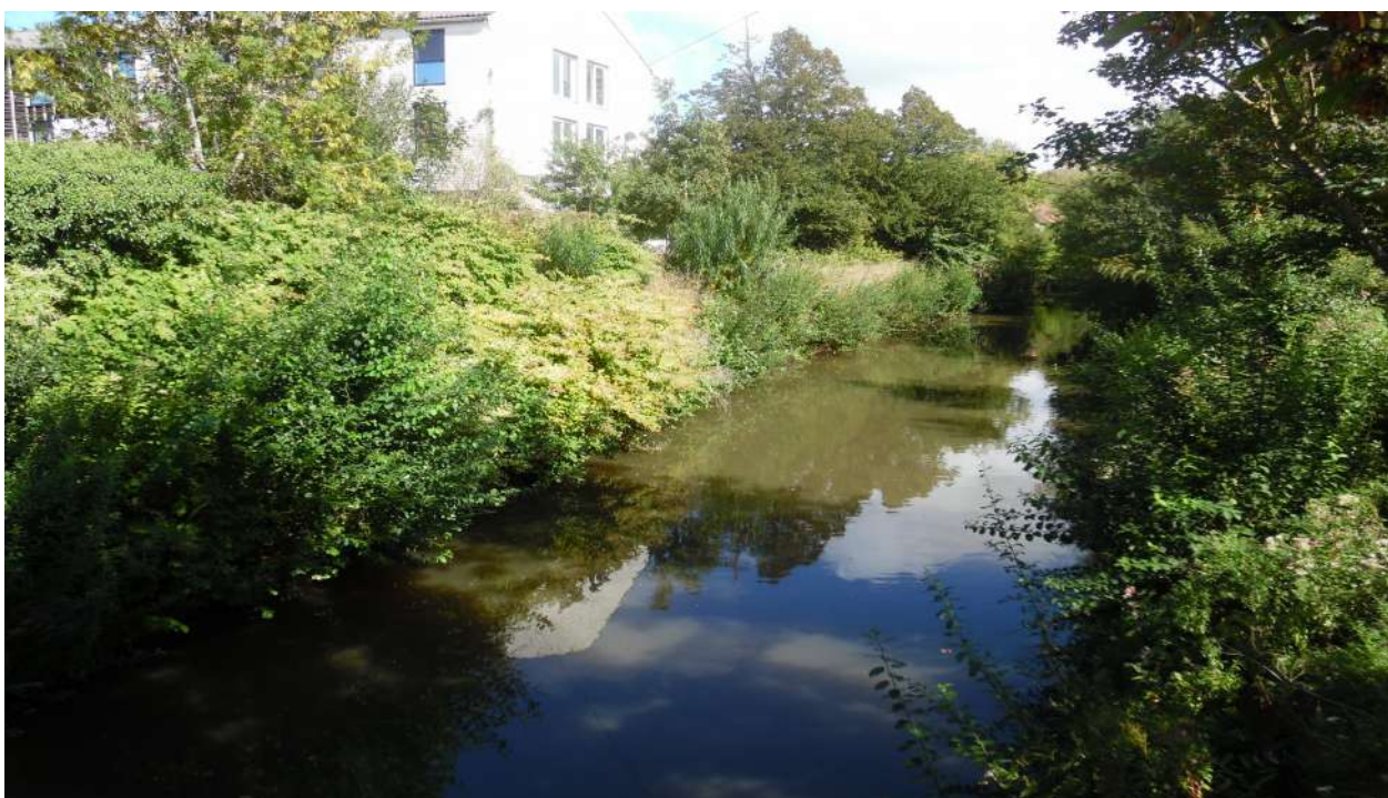
La liane à Pont de Briques le 28 août 2020