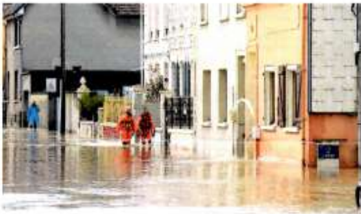
En novembre 2019, la crue de la Liane a surpris plusieurs habitants du Boulonnais, comme ici à Pont-de-Briques.

Par Olivier Merlin Et Alexis Petit | Publié le 13/11/2020